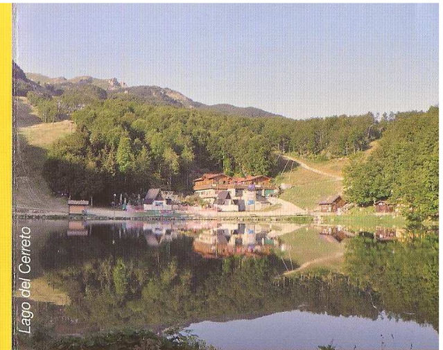
Lago del Cerreto